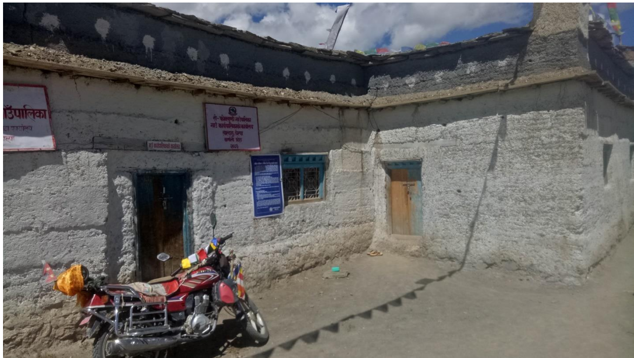
शे-फोक्सुण्डो गाउँपालिकाको कार्यालय